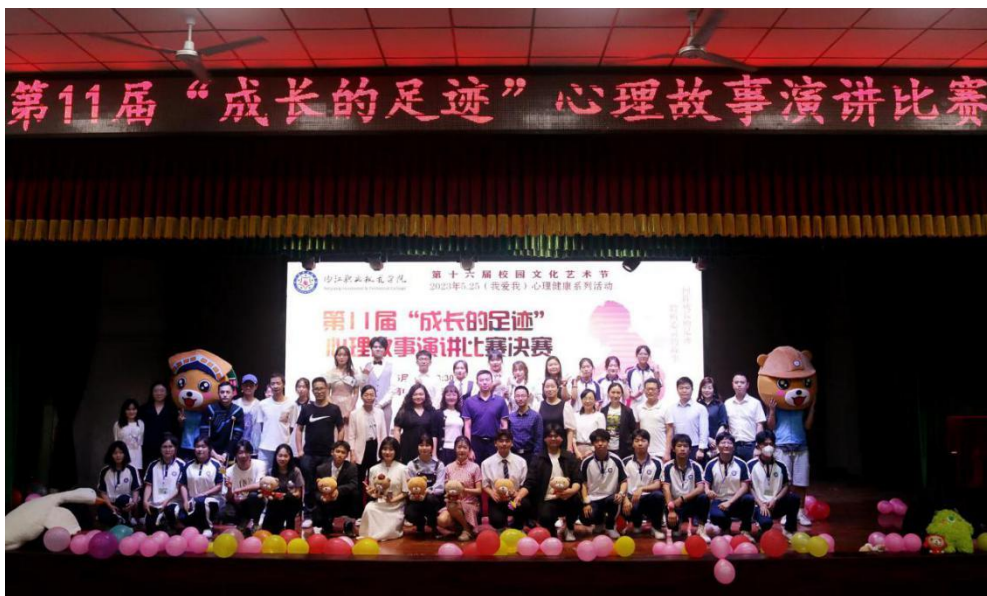
图4 学院举办心理故事演讲比赛

学院创立“1234”心理育人模式，以一个品牌活动为特色亮点、两大心理活动月为坚实抓手、三支育人队伍为主干力量、四级心理危机干预体系为防护网络，有条不紊、稳扎稳打进行心理育人工作，实现了教育教学全覆盖、实践活动反响好、心理服务多形式、预防干预有成效、心理健康教育与课程思政相结合，学生综合素质提升的心理育人成效，并被评为“四川省高校思想政治工作第二批精品项目”。