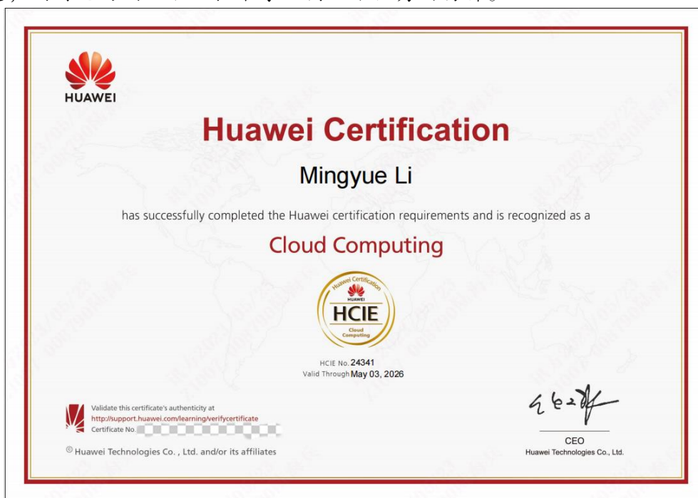
图 10 李明月同学获得华为云计算 HCIE 认证

这一成就再次证明了李明月的决心和毅力。她不仅在专业技能上出类拔萃，在学业上也展现出了非凡的实力。她的成功故事激励着更多的学生去追求自己的梦想，同时也为内江职业技术学院树立了优秀的榜样。