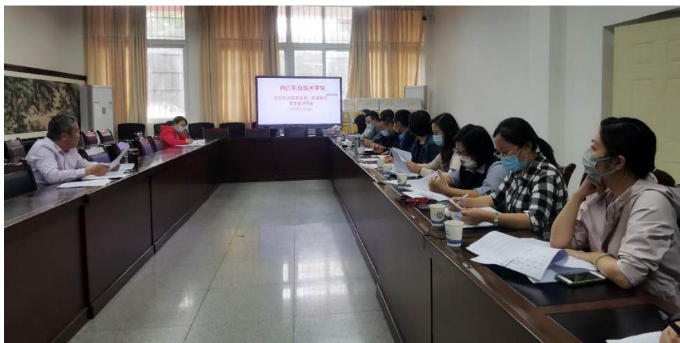
图 11 2022 年秋季学期国家奖学金、励志奖学金评审