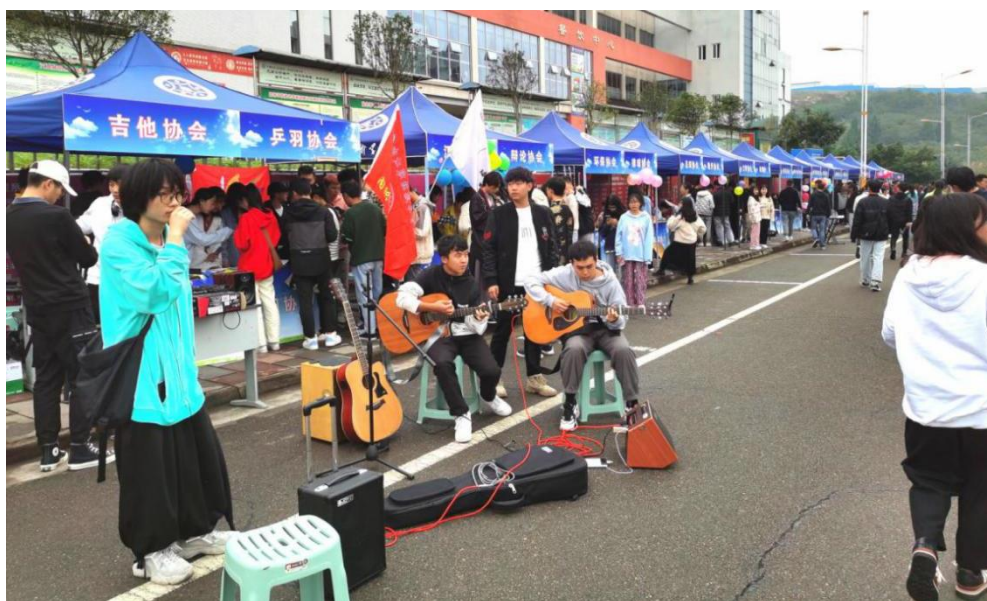
图 1 社团招新活动现场