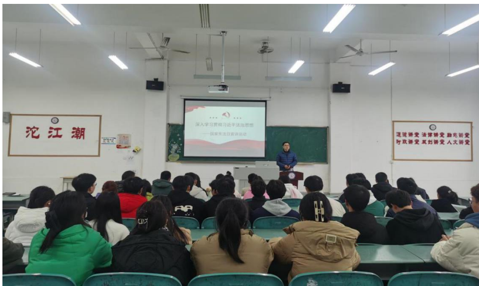
图 23 沱江潮六大讲堂活动现场