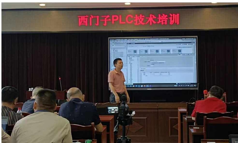
图 17 学院教师为企业培训员工

学院加入“成都电子信息产业生态圈联盟”，为打造具有成渝地区的世界级电子信息产业集群贡献力量；加入国家现代猪业产教融合共同体、中国柑橘行业产教融合共同体，成为副理事长单位，推进科教融汇，促进现代生猪产业、柑橘产业发展；加入内江市交通物流协会，依托协会及成员单位，为市内各区县物流产业园及成渝主轴、川南渝西、西部陆海新通道物流基地提供岗位人才。