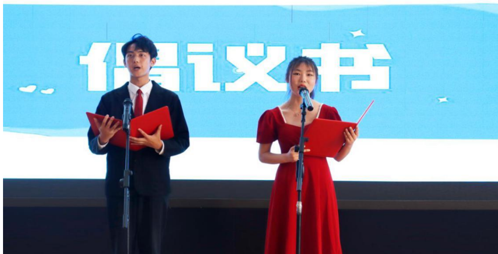
图 18 第二届校园阅读文化节暨网络文化节启动