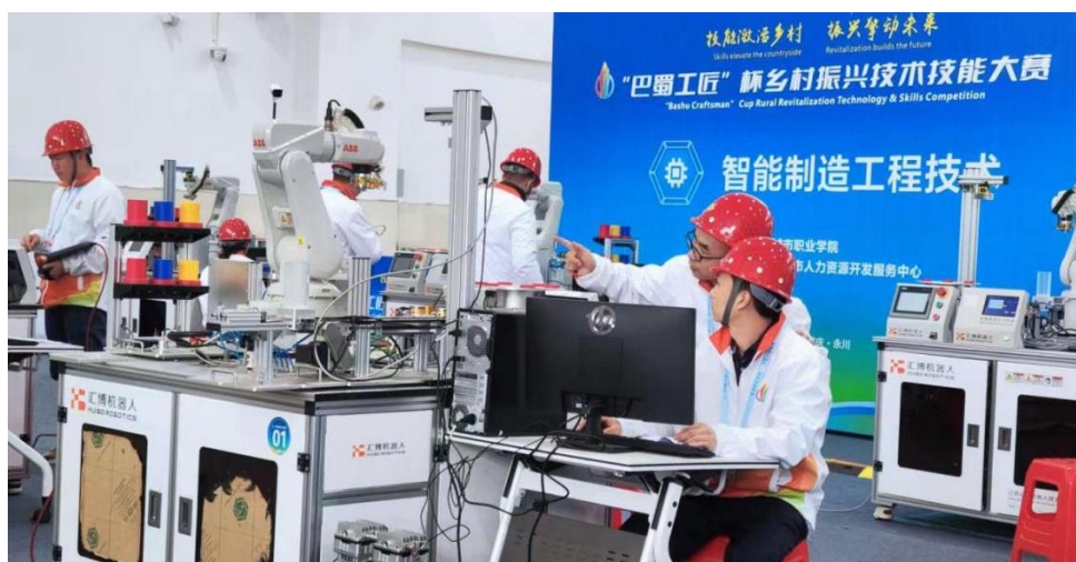
图 15 教师个人参加“巴蜀工匠”杯乡村振兴技术技能大赛