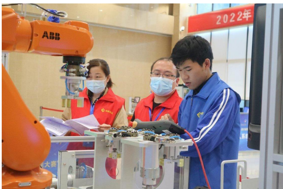
图 5 学生参加 2022 年机器人系统集成竞赛

本学年学院组织学生积极参加各级各类比赛 77 项，获得省级以上奖项 326 项，共计 875 人次。其中国家级一等奖 4 项，二等奖 8 项，三等奖 18 项。参加四川省职业院校技能竞赛 26 个赛项的竞赛，获奖 38 项，共计 90 人次，在四川省参赛的 86 所高职院校中排名第 11 位。同时，学院还积极组织学生参加省级本科高校大学生竞赛 16 个赛项的角逐，获奖 212 项，共计 472 人次，在 67 所参赛职业院校中位列第 6 位。