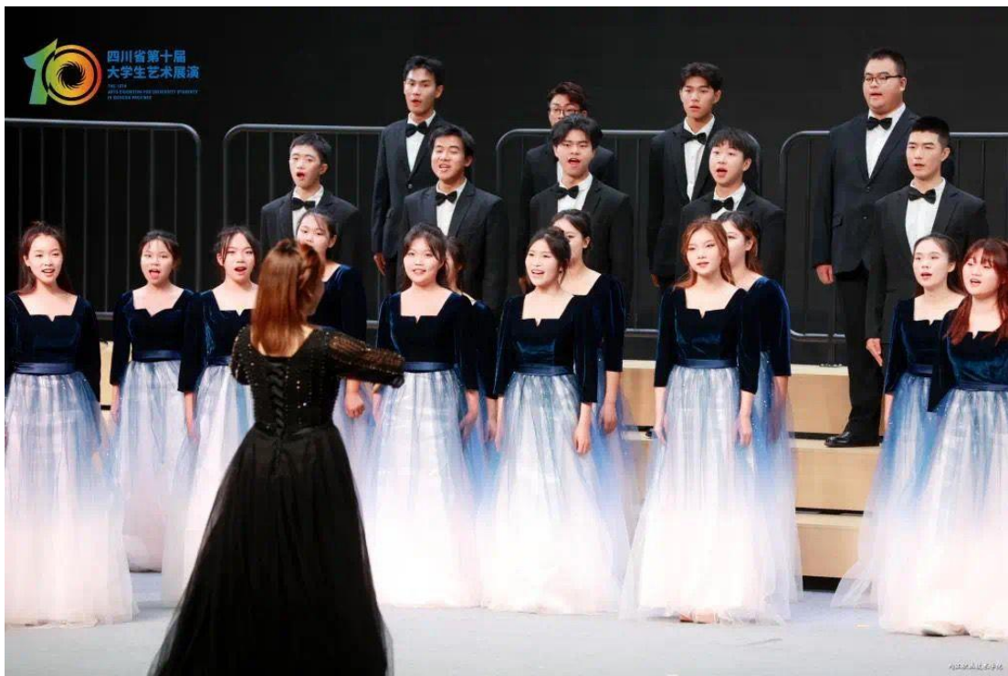
图3 学生参加四川省第十届大学生艺术节比赛

2023年，学院参加省教育厅主办的四川省第十届大学生艺术节展演，推荐的11件参展参演作品全部获奖，其中一等奖6个，二等奖5个。获得的一等奖的数量位居全省高校第23名，高职高专院校第2名。