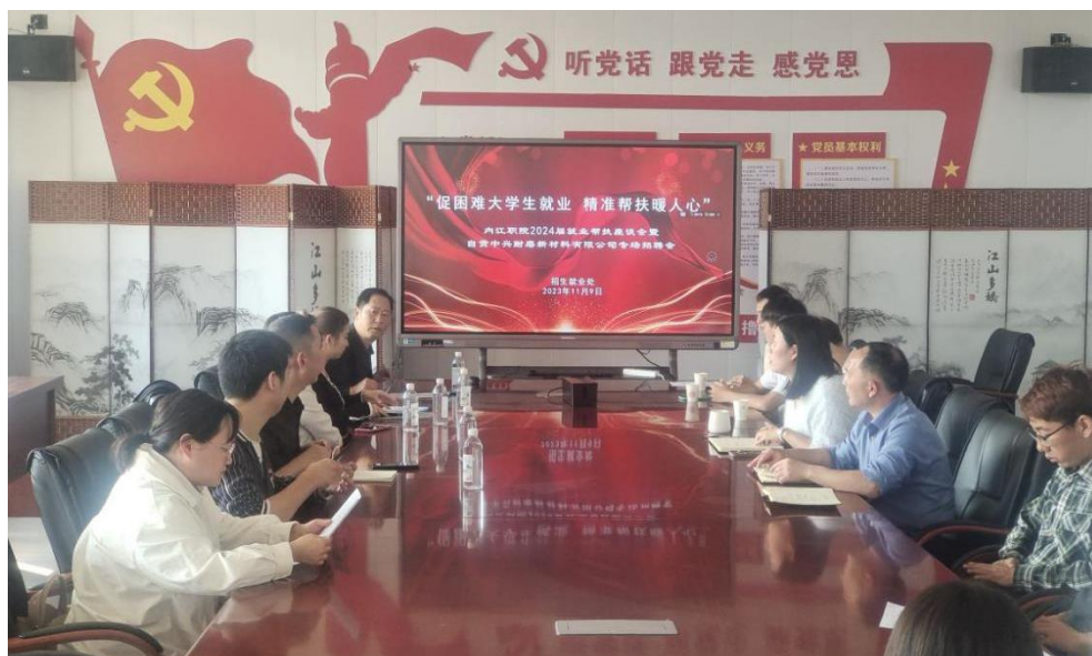
图 7 毕业生帮扶座谈会暨专场招聘会

学院为毕业生组织开展“宏志助航计划”高校毕业生就业能力培训。学院邀请内江市残联、东兴区残联、内江市就促中心、内江驻成都农民工工作站进校开展困难毕业生就业帮扶座谈会,为困难群体毕业生组织专场招聘会,为困难毕业生“送岗上门”。学院建立了一套困难群体毕业生就业帮扶工作体系,充分发挥好了桥梁纽带作用,深度挖掘适合困难群体特别是残疾毕业生的就业岗位,千方百计为同学们提供就业服务,护航困难毕业生顺利就业。