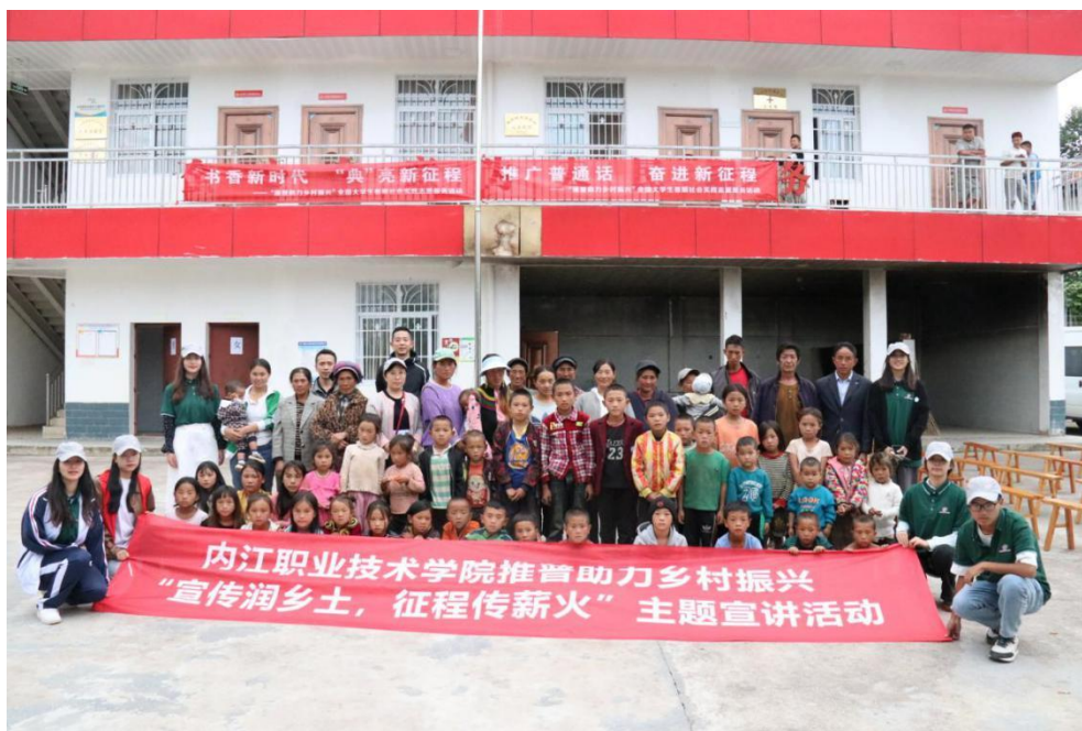
图 19 学院“同语同心”推普助力乡村振兴主题活动

培训、农村基层干部普通话推广和能力提升专项培训、绘制推普墙绘、推普文艺汇演、“童伴之家”关爱课堂等系列活动，在当地发起推普问卷调查 20 余户，悬挂推普宣传标语 10 副，培训基层干部、农村实用技术人才等 30 余人次，帮助村民通过电商平台销售苹果、花椒近 150 斤，关心关爱留守儿童 40 余人，募集并捐赠学习用具、生活用品及御寒衣物等物资 180 余公斤，村民近 500 人次参与到相关活动之中。团队有效促进了国家通用语言文字在民族地区农村的普及程度和使用情况，提升农村基层干部和电商从业人员普通话能力，助力乡村产业、人才、文化振兴。