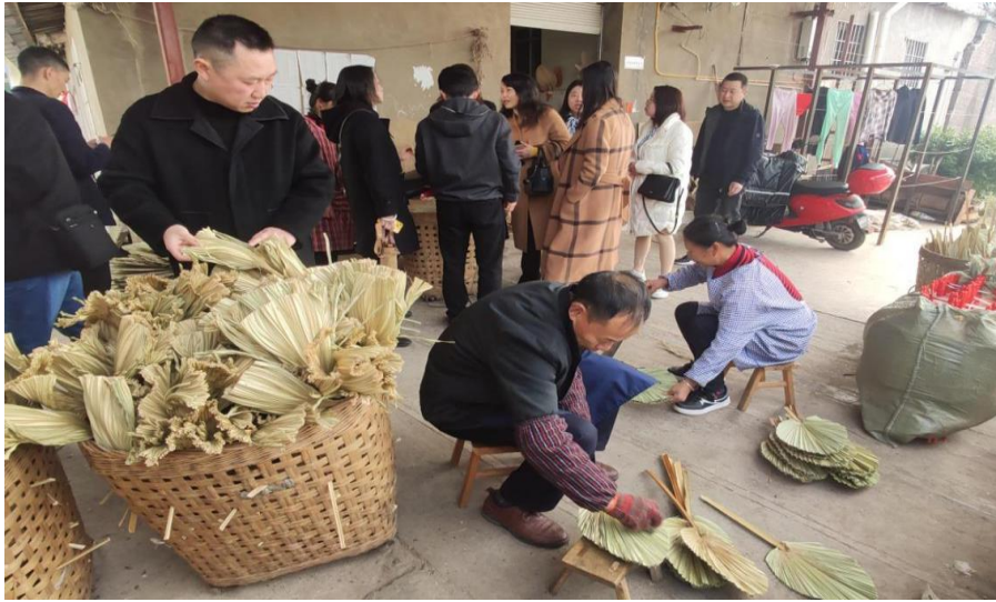
图 21 内江市蒲葵产业品牌升级调研